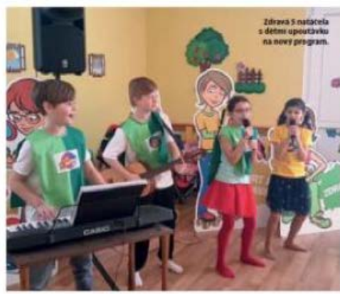
Zdráva 5 matička s dětmi upoutávku na nový program.