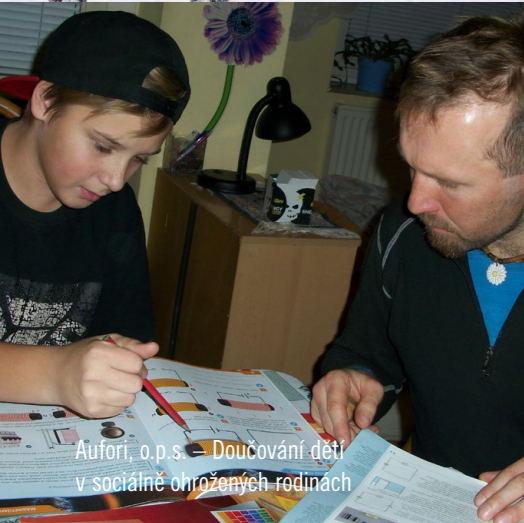
Aufori, o.p.s. – Doučování dětí v sociálně ohrožených rodinách