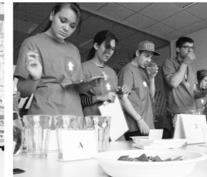
OCHUTNÁVKA. Děti hodnotily vzorky mléčné čokolády jako správné kvalitáři.

praktické cvičení. A to pěkně sládká. Před školáky totiž postavil několik vzorků čokolády. Na základě svých smyslů a preferencí měli všechny obhodovat a vybrat tu nejlepší. Taková práce by je bavila a