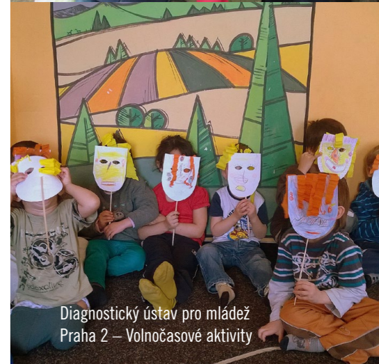
Diagnostický ústav pro mládež Praha 2 – Volnočasové aktivity