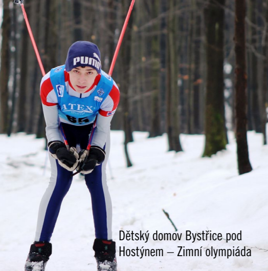
Dětský domov Bystřice pod Hostýnem – Zimní olympiáda