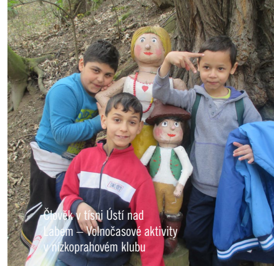
Člověk v tísni Ústí nad Labem – Volnočasové aktivity v nizkoprahovém klubu