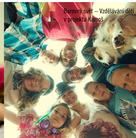
Barevný svět – Vzdělávání dětí v projektu Kámoš