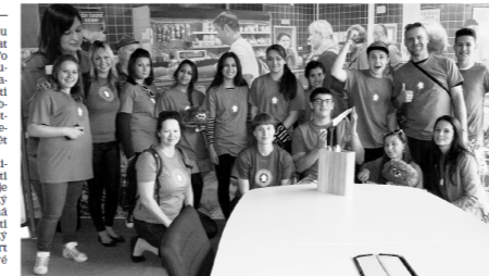
PROHLÍDKA. Děti z dětského domova v Poštině navštívily v sobotu centrálu Alberta v pražských Nových Bělohovech.

První děti přejely do Alberta z dětského domova v Poštině. Jejich první kroky vedly do krytu v podzemí. Prohlédly si totiž celou budovu odspoda až nahoru. Podívaly se, v jakém prostředí pracují nákupčí zboží, jak vypadá marketingové nebo finanční oddělení. Samozřejmě nejvíce je zajímalo, v jakém prostředí