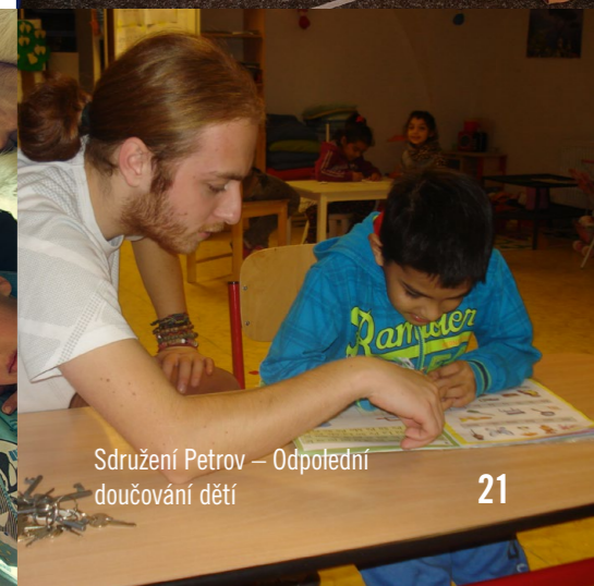
Sdružení Petrov – Odpovědné doučování dětí