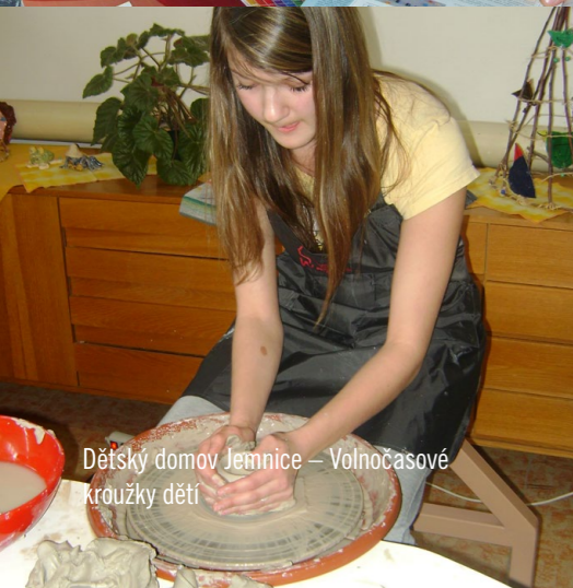
Dětský domov Jemnice – Volnočasové kroužky dětí

KÁVOMATY POMÁHAJÍ – v roce 2015 se otevíraly další nové prodejny, které přímo na své prodejní ploše měly umístěny charitativní kávomaty. Výtěžek z prodeje kávy a čaje z tohoto kávomatu byl v „regionálních grantových výzvách“ přidělen neziskovým organizacím v blízkém okolí prodejny. V roce 2015 bylo uzavřeno v rámci tohoto programu 27 smluv v celkové částce 970 875 Kč :